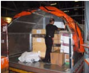
Ukládání balíků do ULD

Ukládání balíků do jednoho kontejneru typu ULD, který je následně mechanizovaně manipulován, umožňuje odstranění ruční manu-