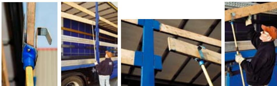
Nástroj pro rozebírání příčnic přívěsu

V přístupu k břemenům může často pomoci jednoduché upravení nebo vytvoření nástroje. Obrázky níže ukazují nástroj, který si vytvořil dopravce, aby se snadněji dostal k volným latím (příčnicům) na přívěsu v případě, že je nutno je rozebrat.