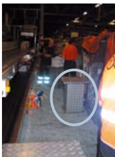
Zdvihání pomocí zdviháče

Výšku lze přizpůsobit rovněž pomocí zdvihacího zařízení nebo, jak je znázorněno níže, pomocí „zdviháče“, který usnadňuje uchopení balíků vycházejících z přepravní jednotky.