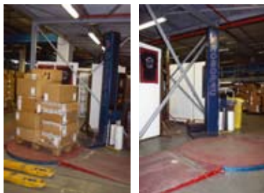
Automatický stroj na balení do smršťovacích fólií

V přístupu k břemenům může často pomoci jednoduché upravení nebo vytvoření nástroje. Obrázky níže ukazují nástroj, který si vytvořil dopravce, aby se snadněji dostal k volným latím (příčnicům) na přívěsu v případě, že je nutno je rozebrat.