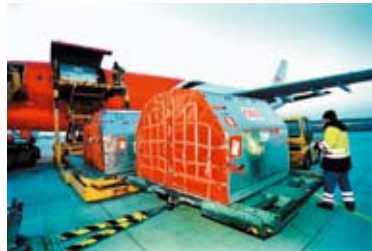
Mechanizované nakládání ULD do letadla