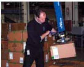
Vakuové zdvihací zařízení

Používání technických zdvihacích zařízení, která omezují ruční manipulaci, je jedním ze základních preventivních opatření.