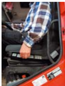
Správné nastavení sedadla