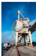
Automatizovaná hromadná nakládká