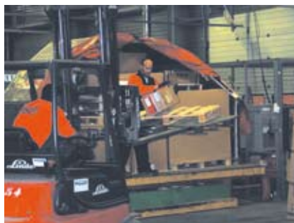
Zdvihání pomocí vysokozdvížného vozíku

Vzdálenost břemene od těla pracovníka určuje maximální přípustnou zátěž. Níže je uveden přehled maximálních hmotností břemen v závislosti na výšce úchopu a vodorovné vzdálenosti od pracovníka.